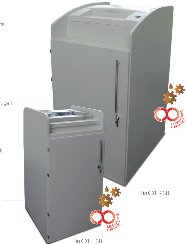
DoX XL 160