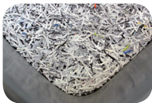
Snippers opvangen in container